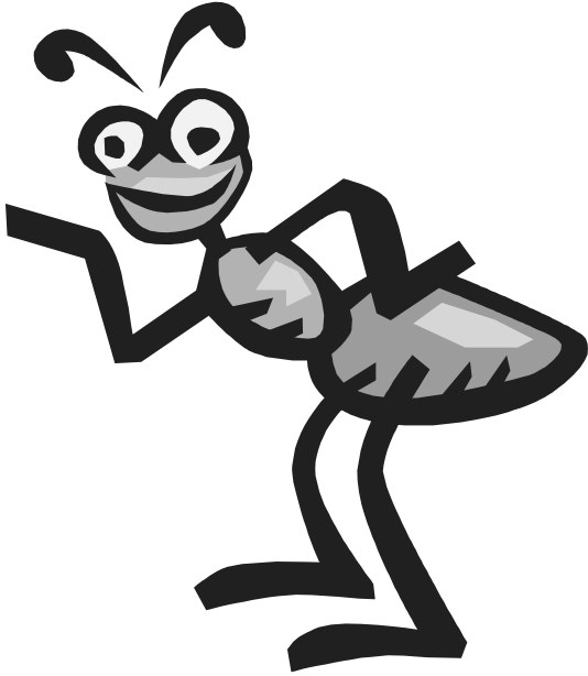
Caricatura de hormiga